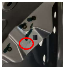
变更前（下方有圆孔&焊接螺母） 变更后（下方无圆孔&无焊接螺母）

原电动尾门ECU安装支架，使用了上方所描述的圆孔&焊接螺母。由于车身结构发生了变化，下方圆孔&焊接螺母取消，导致尾门ECU支架无法安装。